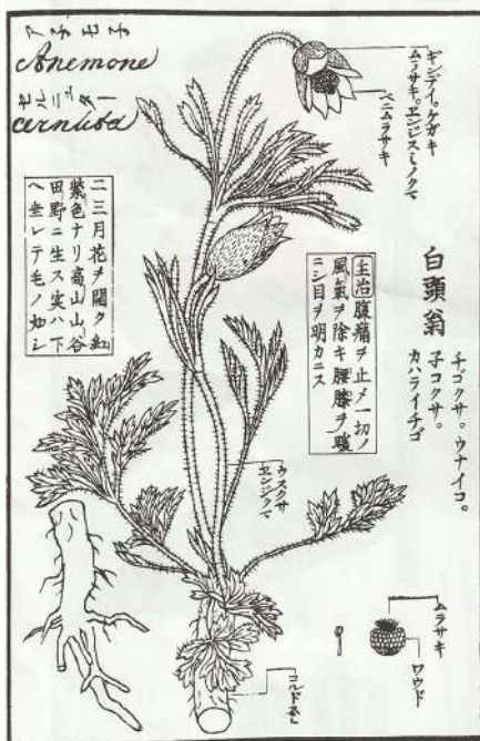
図1 川原慶賀が描いた白頭翁 (大場秀章「植物学と植物図」による)

にあるコマロフ植物研究所に完全に保存されていたので、1994年、丸善から「SIEBOLD'S FLORIGIUM OF JAPANESE PLANTS、日本植物花譜」として出版され、これは落合武夫（1919～？）から庄原市立比和自然科学博物館に寄贈されているので、身近で容易に閲覧することができる。