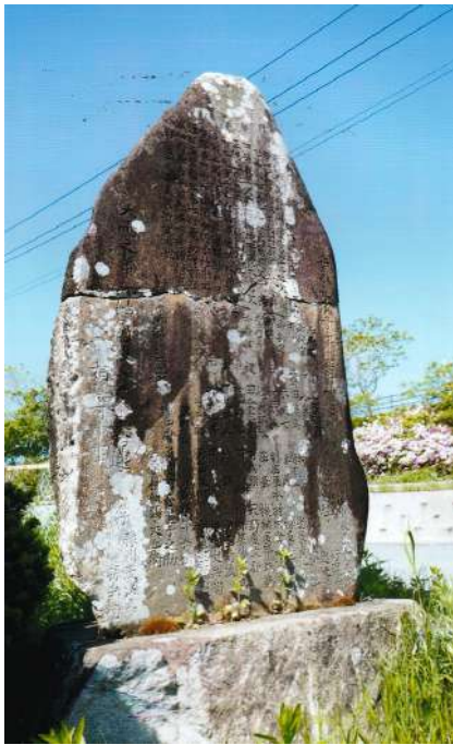
①上野池の西入口付近に陣取っている「疎鑿（そさく）」の記念碑