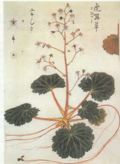
図2 虎耳草 (ユキノシタ) (シーボルト「日本植物花譜」による)