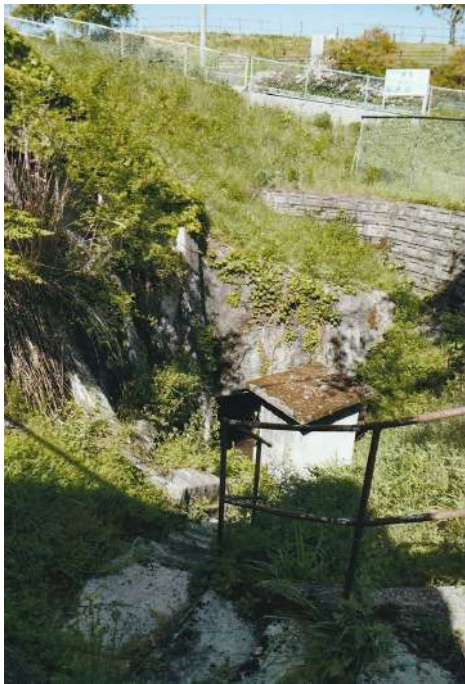
②上野池西側にあるホリコ。中央の小さな穴が入口です。手前の手すりのついた石段から降りて行きます