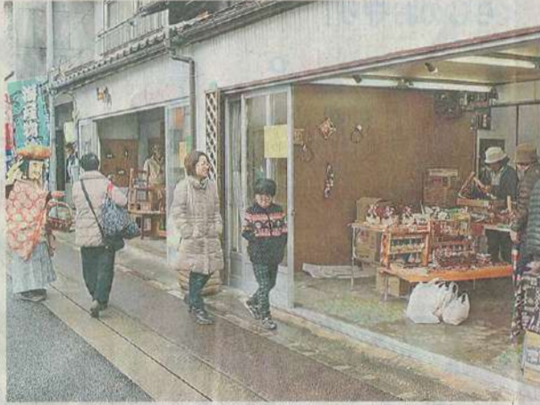
庄原市中心部の商店街で開かれた九日市の初市