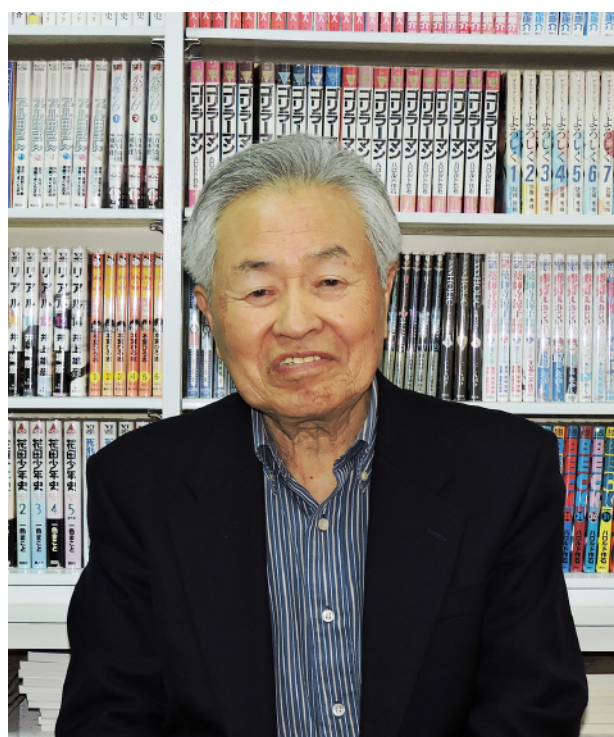
どら書房漫画ルームにて撮影

「文学部では、国史科がね、他核を担うなど、郷土史研究のに比べて競争率が低かったん 功績は大きい。」