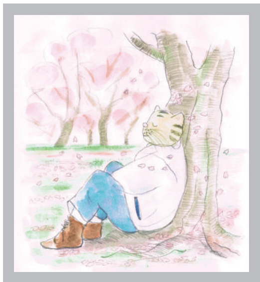
この絵をブックカバーにしています。