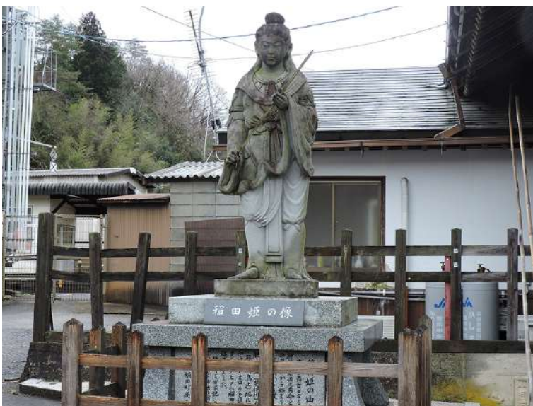
駅舎の隣にある「稲田姫の像」