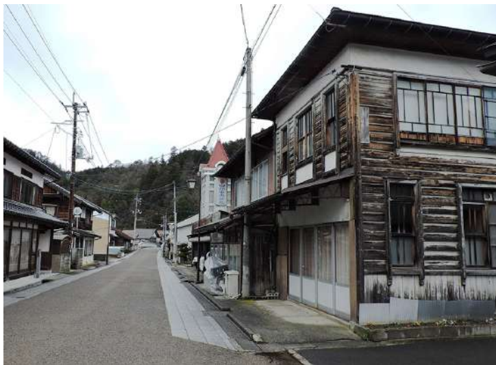
歴史ある古い町並みが残っている。