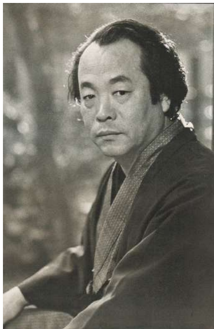
火野葦平(昭和34年12月撮影)。「革命前後」(中央公論社)より転載

部軍報道部の宿舎に割り当てられている。本土決戦で真先に敵兵が上陸してくるであろう九州の地で、戦意高揚の報道活動のために組織された部署で、作家や映画監督、音楽家に画家と、さまざまな文化人が徴用されている。敗色濃厚の中、本音や建前が渦巻いて、魑魅魍魎が跋扈する伏魔殿の様相だ。中には九州を独立させて軍政を布き、革命政府を作って米軍を迎撃しようという動きもある。戦局はますます悪化、昭和20年8月6日広島市、同9日に長崎市に新型爆弾(原爆)が落されて焦