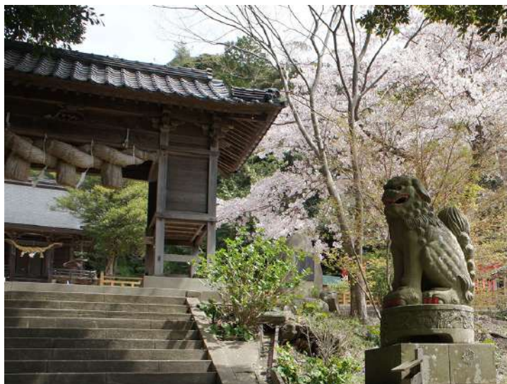
狛犬の爪が赤く塗られている

江方面で、2番線が出雲市方面。木次線が3番で（送電の）架線が張られていない。つまり、気動車（ジーゼル動車）専用の乗り場なのである。レトロな木造の跨線橋の階段を登って、駅舎のある1番ホームに降りた。備後庄原駅の跨線橋を思い浮かべた。昔ながらの跨線橋は、今では稀少である。改札で整理券を提示して運賃を精算、190円。改札を出る客は数人で、山陰本線への乗り換え客がほとんどなだらう。駅舎は平成29年（2017年）に改修されて、モダンな雰囲気。待合室のベンチにもかなりの人が坐っている。出入口の庇の柱に掲げられた「宍道駅」の古い看板、勇壮な墨痕が印象に残った。駅に隣接する郵便局の前にタヌキの石像がある。帽子を被って、差し上げた右手に乗っているのは伝書鳩だろうか。宍道町内には、こうした来待石製のタヌキの石像が60匹いるという。タヌキは福を呼ぶ縁起の良い動物で、語呂合わせで「他抜き」、他店よりも抜きんでるといふ商売繁盛の願いも込められている。来待石は、宍道湖の南岸（松江市宍道町の来待地区周辺）で採れる「凝灰質砂岩（ぎょうかいしつさがん）」、1400万年前の火山堆積物が海底に堆積して形成され