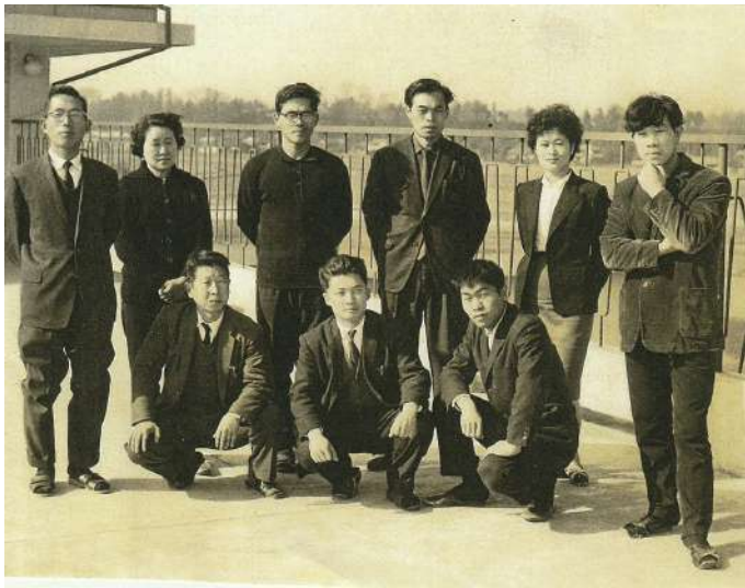
中学の学科担任の先生（右から2人目がY先生）

人生で最初の出合いは、父母、祖父母、弟たち。これはもう運命というもので、私の大切な肉親との出合이었다。その後は幼稚園、小学校、中学校、高校や専門学校、その時々に出合いがあった。小学校まではクラス担任の先生との繋がりが強かつ