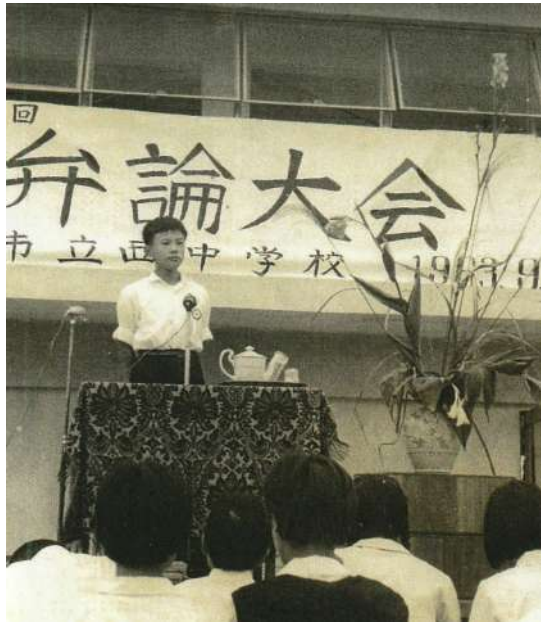
中学生時の弁論大会

星製薬の社長、星氏は星薬科大学の理事もされていた人で、隈笹エキスや化粧品の話も精力的に語ってくれたが、何より心に残ったのはそのジェントルマンぶりだった。当時私が如水会会長をしていた三十代後半