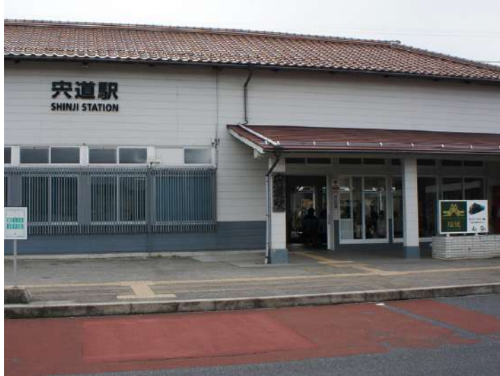
ホームにはレトロな跨線橋が残っている

6分程で宍道駅に到着。宍道駅は山陰本線の駅として明治42年（1909年）に開設された。簸上鉄道線（後の木次線）の接続駅になったのは大正5年。ホームが2つ、乗り場が3番線まであって、原則として1番線が山陰本線の松