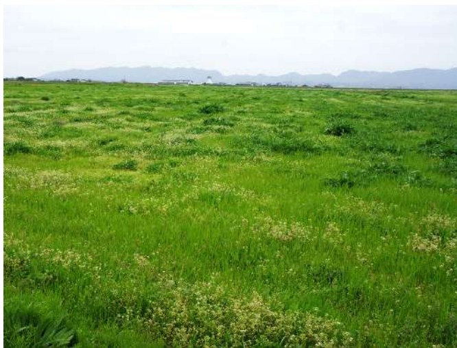
干拓地の「昭和新田」の大草原

9号線に上がり、西に向か って進むと護岸がある。宍道湖の反対側の土手には群生するハナダイコンの白い花が咲いていた。その西