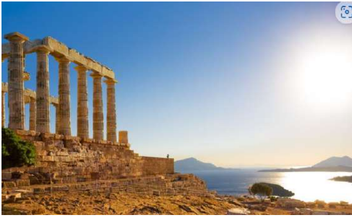
スニオン岬にあるポセイドンの神殿（左）

3月9日、アテネ（ギリシャ）。かつて、ギリシャは海運王国であった。船舶で世界に物資を輸送することで国に収益をもたらしていた。アリストテレス・ソクラテス・オナシスは船主として有名で、彼は葉巻とサングラス、美女を愛した。