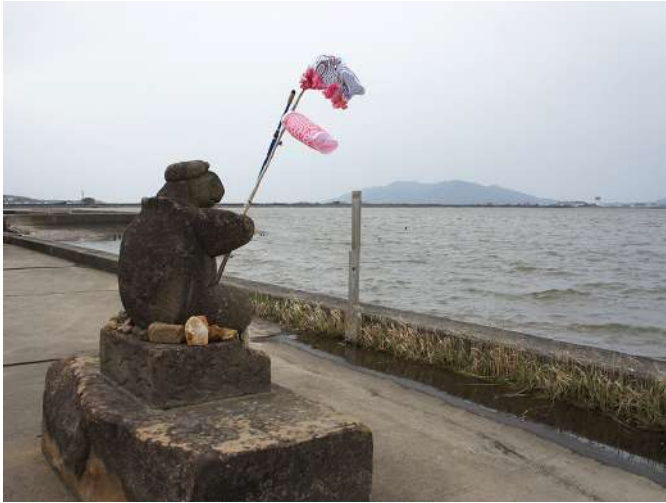
湖岸の亀の石像が2メートルも後退