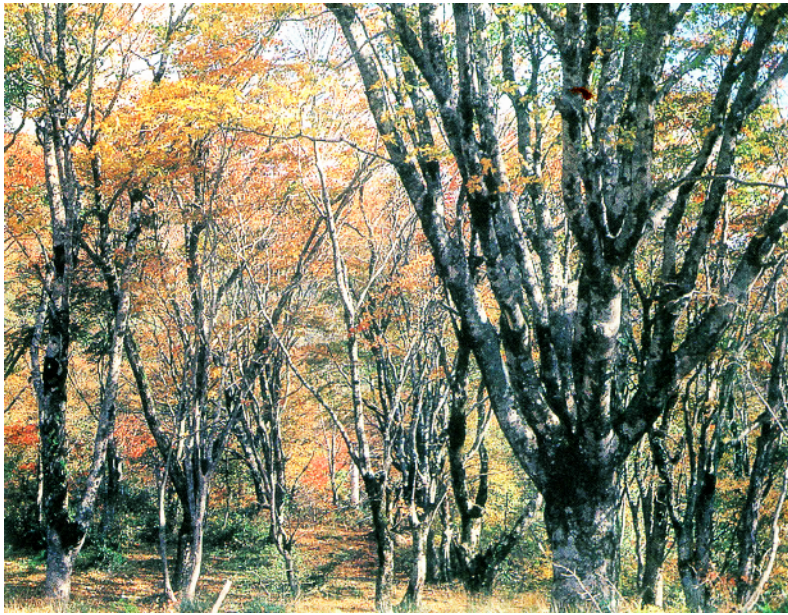
比婆山連峰の原生林

中国山地の北面を占めている飯(くすのき・クス)、椎(しい・スダ石・仁多両郡から記録されている植(ジイ)、楊梅(ヤマモモ)は温帯の樹物は重複している十五種をふくめ、木で現在は島根半島など出雲地方の延べてみると五十三種に達する。楠 沿岸部に見られる。これらの樹木が