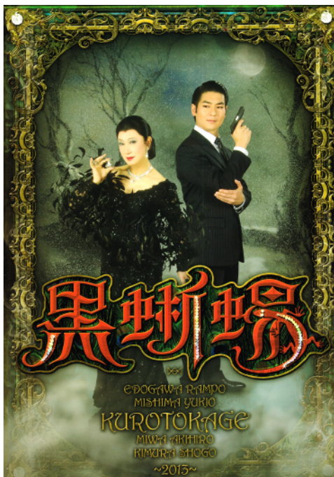
「黒蜥蜴」(2013年) 舞台用パンフレット

た。そのデザインを気に入った美輪さんの逆指名で、その後の美輪さんの著作、コンサートや演劇のポスター、パンフレット、携帯サイトなどのデザインすべてを任せられることになって今年で二十七年になる。来年も寺山修司作「毛皮のマリー」の舞台ポスターを製作する。