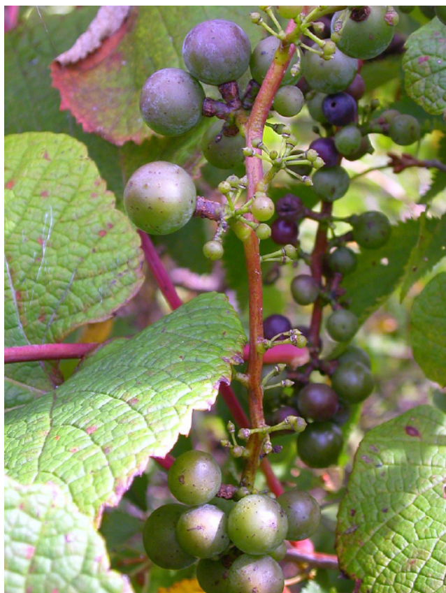
ヤマブドウ (フリー百科事典「ウイキペディア」から転載)

もヤマブドウに混じって中国山地に見られるが、果実のひとつまわりも大きいヤマブドウを古代の仁多郡の人びとは恐らく珍重したことであろう。ヤマブドウの実る頃、ムラビトは山をかきわけて実をとり、また、峠を越える人びとはその実で渴を癒したことであろう。千年を経た今日、峠でヤマブドウの茂みを見るにつけ、深い感慨を覚えると共に自然の永遠性に畏敬の思いをいたす。