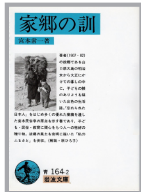
【岩波文庫版の表紙】

第33回は、宮本常一の『家郷の訓』です。もし興味を持ったらぜひ読んでみてください。