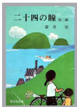
【旺文社文庫版の表紙】

古今東西の文学にはたくさんの名作があります。そんな名作の中から筆者の心に残る作品を今の青年たちにも読んでもらいたいと思い、毎月1冊ずつ紹介しています。