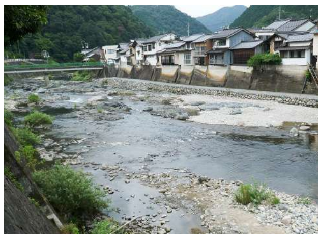
百三の文学碑から見下ろした西城川。左方向が下流で、庄原方面