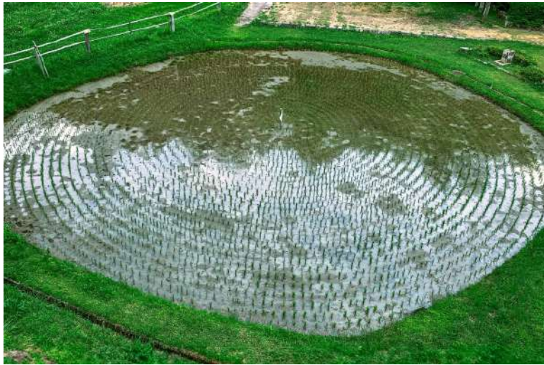
岐阜県高山市で受け継がれている車田（笑田？）