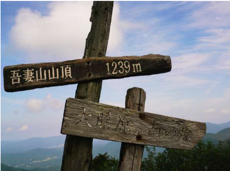
比和町の吾妻山の山頂。イザナギの命が帰ってきたときに「噫々吾が妻よ」とイザナミの命を呼んだという伝承がある。

庄原市峰田町の本村川沿いの町に赤川の地名がある。合戦があったという伝承はない。そして、西城川と比和川の分かれのところに、濁川町がある。本村川も比和川も、たたら製鉄の本場で栄えた場所であるから、かなな流しの赤い濁り水が流れていたのだろう。どうやら、それが地名の由来であるようだ。