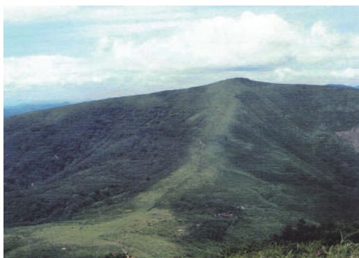
写真3 1974年当時の吾妻山東斜面の景観 (吾妻山植物誌)

斜面から大膳原の一带をススキ・ホクチアザミ群落としているが、ここでもススキ・ホクチアザミ群落は確認することはできなかった。