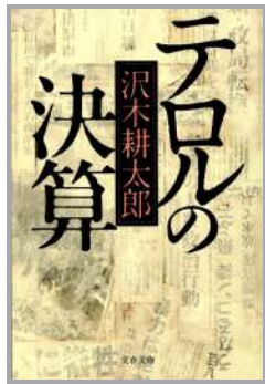
【文春文庫版の表紙】

古今東西の文学にはたくさんの名作があります。そんな名作の中から筆者の心に残る作品を今の青年たちにも読んでもらいたいと思い、毎月1冊ずつ紹介しています。