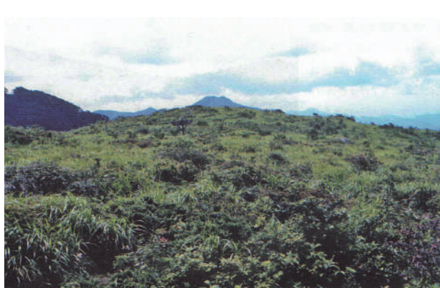
写真1 南ノ原のシバ草原と斑状群落 (1974年8月5日撮影)

て放牧される和牛の頭数が減少するにつれ、南ノ原へ移動してくる和牛はなくなり、南ノ原のシバ草原は急