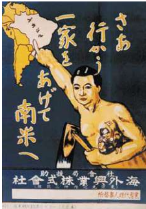
海外興行会社による広告

ペルーの日本移民は数々の困難な状況を乗り越えて確固たる地位を築き、アルベルト・フジモリ大統領（熊本県がルーツ）を誕生させている。