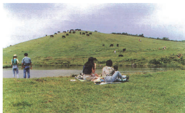
写真2「吾妻山」(入選作品) (1991年中国山地豊かな自然写真コンテスト)