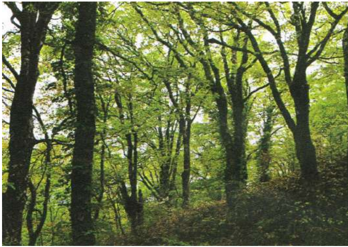
吾妻山のサワグルミ林 (吾妻山植物誌2018による)

ブナ林が皆伐された跡地で、植林されなかった標高700m以上のところは、クリ・ミズナラ・イヌシデ・イタヤカエデ・ウリハダカエデ・リョウブなどの落葉広葉樹から成る二次林へと遷移している。この二次林は、中越・他(1989)によって「ミズナラ・クリ群集」とされている。ミズナラ・クリ群集はブナクラス域の落葉広葉樹二次林であることはいうまでもない。標高700m以下のところは、ヤブツバキ域の落葉広葉