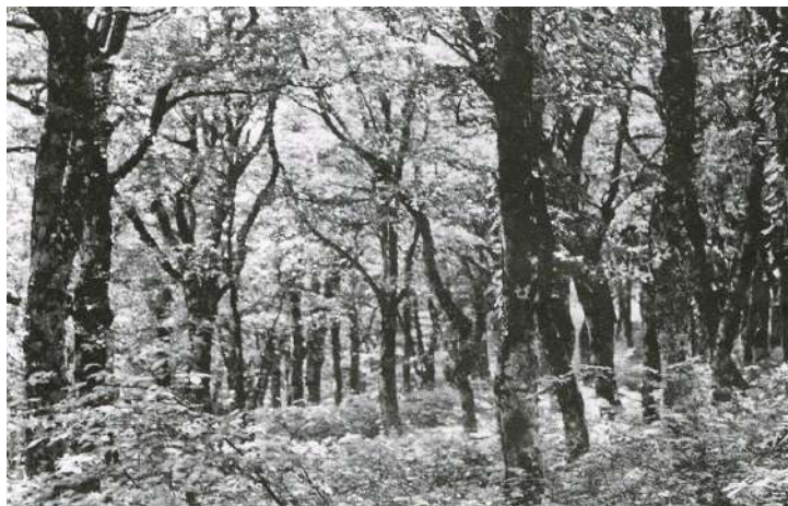
吾妻山南斜面、大池から南ノ原へ向う途中のブナ林(1975年8月撮影)

国の天然記念物に指定されている「比婆山のブナ純林」以外では、立烏帽子山と竜王山間の北斜面の標高