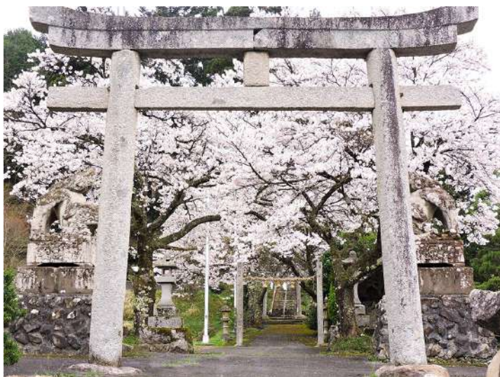
八川八幡神社の桜咲く参道