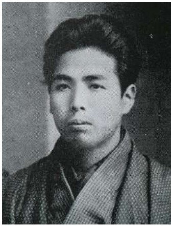
『出家とその弟子』を出した 大正6年ころの百三