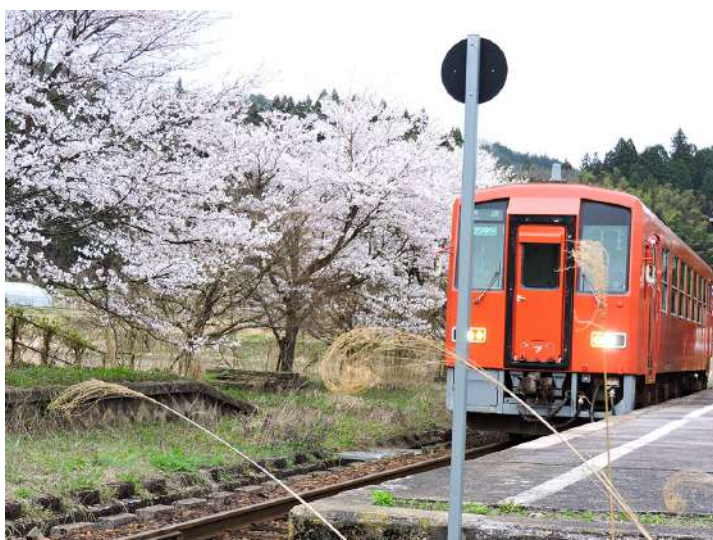
八川駅で停車する列車