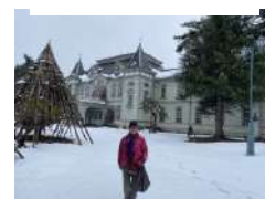
旧米沢高等工業学校本館