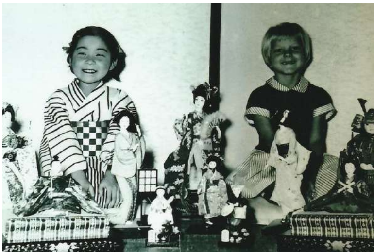
左が筆者で右がタビーちゃん