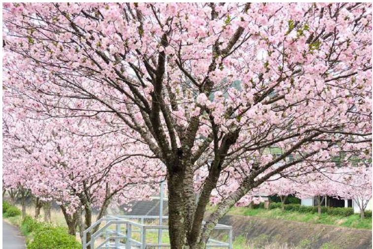
久野川治いの「紅豊」の並木