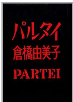
【文藝春秋版の表紙】

古今東西の文学にはたくさんの名作があります。そんな名作の中から筆者の心に残る作品を今の青年たちにも読んでもらいたいと思い、毎月1冊ずつ紹介しています。