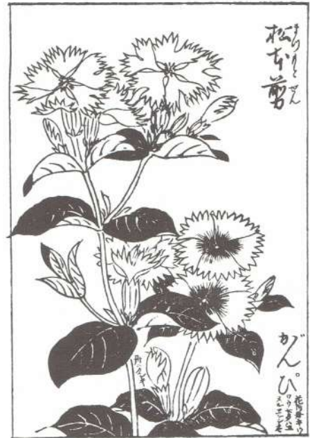
図 3 ガンピ（八坂書房版による）