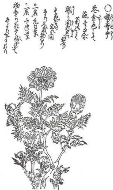
図 2 福寿草（東洋文庫 268 による）