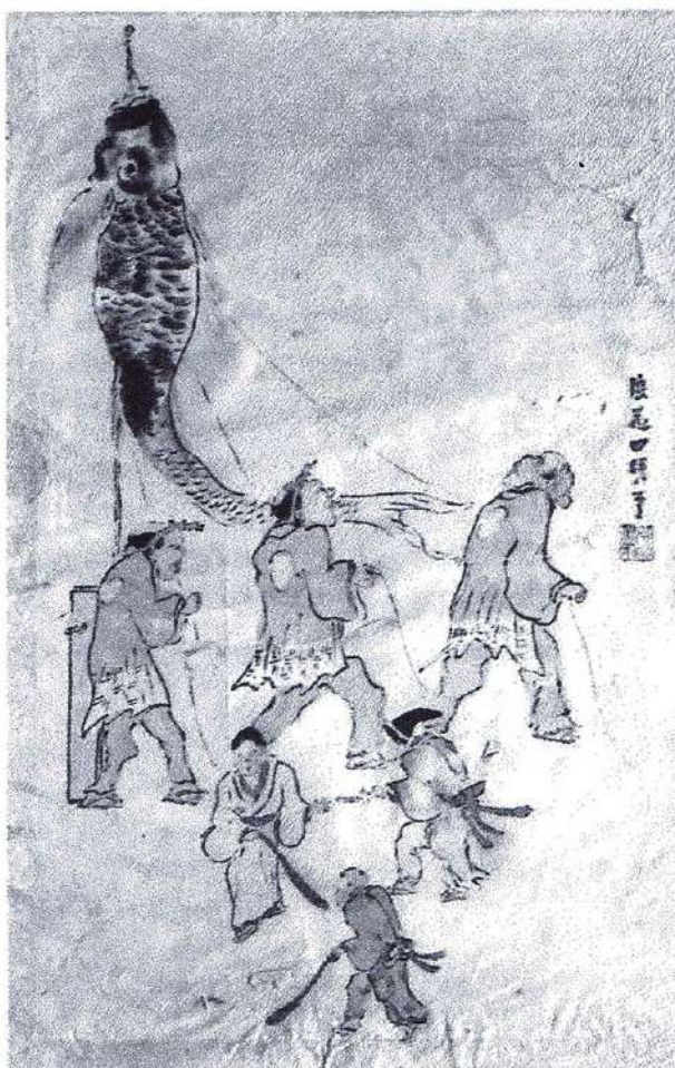
「端午の節句図」（与謝蕪村筆）

つ）・物忌（ものい）み月とし「さつき忌み」と称して、田植が始まる時期に早乙女が家に籠って身を清め、田の神を迎え祭るといふ行事があった。田植をする早乙女、つまり若い女性が穢れを祓い身を清めた。五月の節供はもとは女性の節供であった。五月の節供は、日本古来の「さつき忌み」の風俗と中国伝来の端午の節供が一緒になったものとみることが出来る。