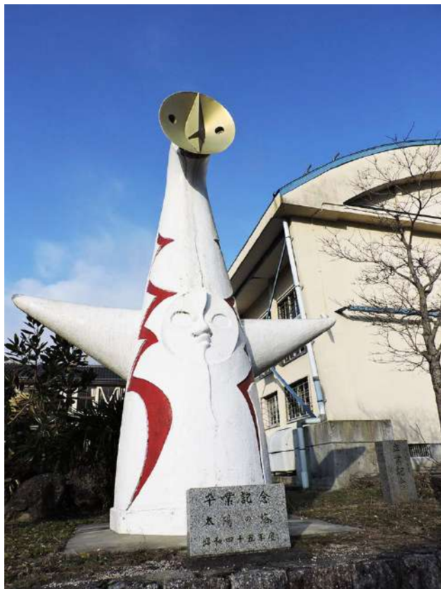
美古登小学校は昨年3月に閉校になった。

写真やスケッチで細かいところまで記録して帰り、父母からも多くの写真や資料が寄せられた。それらをもとに設計し、九月十四日に着工した。毎日放課後、子どもたちは二、三時間作業に汗を流し、父母も四、五人ずつ交代で応援、保護者の中には大工さん、左官さんもいて経費は材料代だけで済んだという。記念碑は