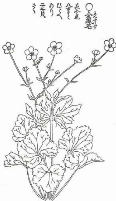
図 1 金鳳花（東洋文庫 268 による）

は小野蘭山 74 歳の 1804（享和 3）年から 1806（文化 3）年にかけて刊行された。蘭山の死後もたびたび刊行され、1847（弘化 4）年、「重訂本草綱目啓蒙」（岸和田本）が出版された。