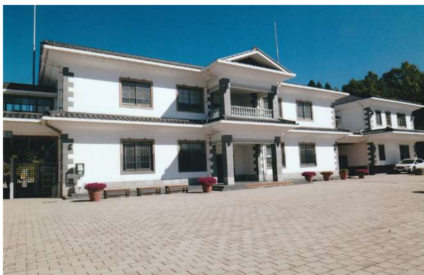
英学校とそっくりで作られた 備北丘陵公園正門のビジターセンター

背景には、江戸末から明治にかけて、めざましく発展した庄原の経済活動があったからです。募金・寄付