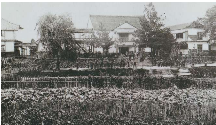
開校時の「英学校」の写真。 移転前の庄原小学校、現在の庄原文化会館の土地