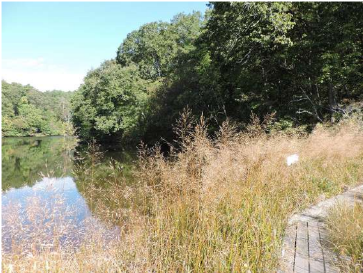
鯉が窪湿原には 380 種類以上の植物が自生。