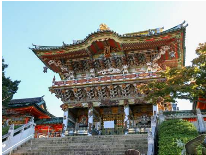
日光東照宮の陽明門を参考にした耕三寺・孝養門

絶景の旅の初回で、島根県の日御碕灯台を訪問、日本海の水平線を眺望した。今回の広島の旅では、