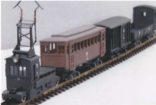
草軽電鉄を走っていた電車の模型

なー！」店のおねいさんも含めて八人の旅なので、皆手分けで車内に持ってゆく。いきなり八人前が売れたおじさんはニコニコ顔だ。祖父と私と弟はSLを二重連にする作業を見るのだが、赤と白の旗を持った駅員の指示で、大きな二両の機関車が近づき「ガッシャン」と連結する時には、見ていたお客達もその圧巻の迫力に、思わず拍手してしまうのだ。