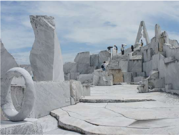
丘の頂からは瀬戸内の島々が眺望できる