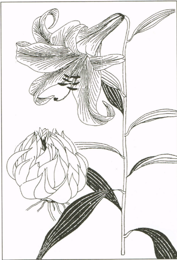
ササユリ(飯沼愨齋著、牧野富太郎再訂増補「増訂草木図説」、図書刊行会版による)

われる。常陸国風土記の読みくだしで櫟をイチイとしているが、櫟は一般にクヌギを指す。櫟は一般にはるのが正しいと思う。柴は一般には燃料に用いた広葉樹を言う。従って燃料とした広葉樹はクヌギ以外に多