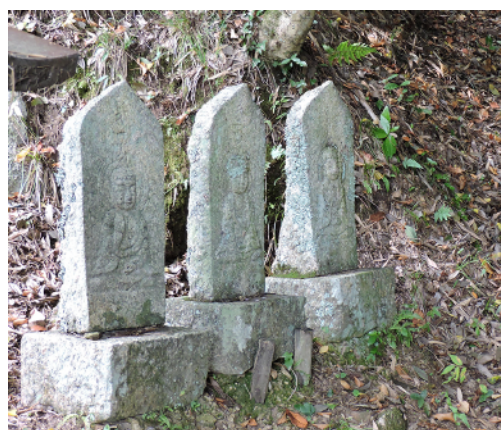
月貞寺（上）と裏山の八十八か所霊場の石仏（左）

（月貞寺の仏さまの教えが月の光が野山を照らすようにくまなく届いているよ。信仰のおかげというものは清らかな