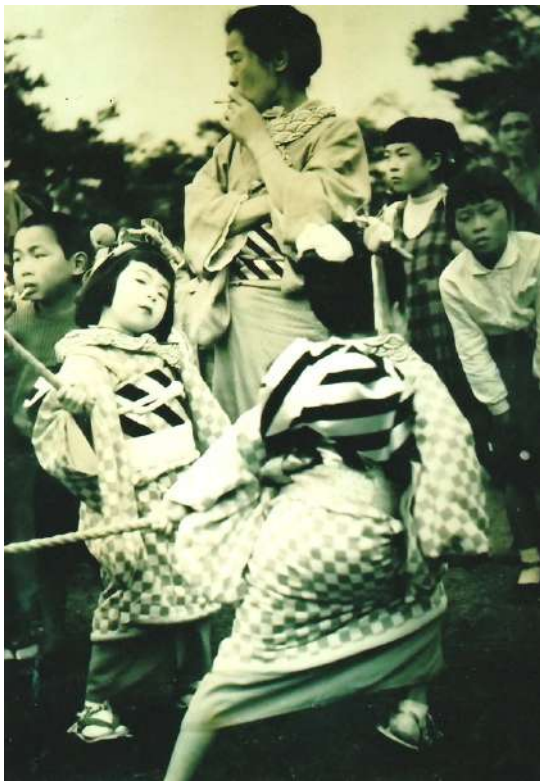
稲荷神社つじ祭り

七月十五日はお天王（てんのう）様のお輿が町中を渡御する“天王祭り”、子供御輿も出て「ワツシヨワツシヨ」と担いで廻るが、後で肩が赤く腫れてしまう。祭り半纏の肩の部分に手ぬぐいを縫い付けておくが、