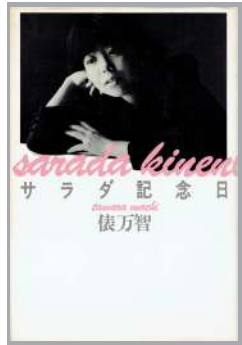
【河出書房新社版の表紙】

古今東西の文学にはたくさんの名作があります。そんな名作の中から筆者の心に残る作品を今の青年たちにも読んでもらいたいと思い、毎月1冊ずつ紹介しています。