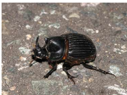
ミヤマダイコクコガネ

シバ草原の消滅によってもろに影響を受けているのは、食糞性コガネムシ類である。比婆山連峰内からはミヤマダイコクコガネなど15種が記録されている(中村、1977)。そのうち、吾妻山から記録されていたミヤマダイコクコガネは、水田・他(1972)が「吾妻山では1日の調査で約50頭」を確認してから後、