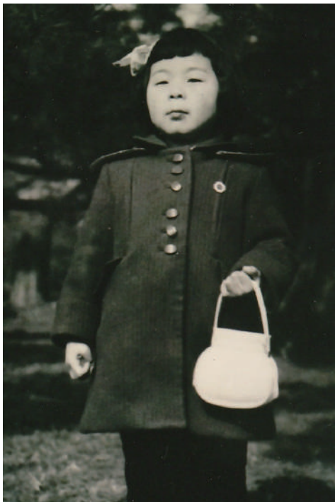
おしゃれをして東京へ (著者)

子供の頃の正月の活気。獅子舞や三河万歳のおじさん達、芸者のお姐さんやお客のおばさん達のあの弾けた笑顔の奥には、大変だった戦時を生き抜き、悲しみを乗り越えた文句なしの命の輝きそのものだったのかなあ、と思えてならない。