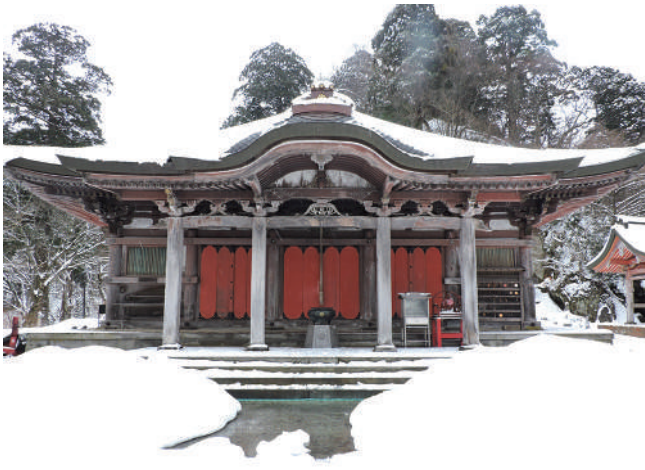
大山寺の本尊は地蔵菩薩で周辺には石地蔵を多数安置