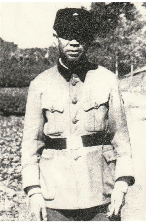
消防隊員姿の祖父

昭和二十年代後半になつてもまだ地下道には「浮浪児」と呼ばれ、家も家族も失くした子供や大人がごろごろ居た。地下道には強い悪臭が漂い、幼かつた私は恐ろしい場所のように思えた。「おばあちゃん、上野は怖いよー」と言うと、「それじゃあ鶯谷から円タクで行こうか:」、鶯谷から浅草へは割と近かつた。当時、百円が基本料金なので円タクと言つたらしいが、運転手さんは復員兵だった人が多かつた。「運転手さんはどちらで終戦でしたか?」「フィリピンで捕虜になつてました:」「この子の父親はインドネシアで捕虜でした。よく生還なさつたねえ:」。タクシーはバラック建てが目立つ町を走り、中見世あたりに着く。祖母は料金の倍ほどの料金を渡し「お子さんにお菓子でも買つて下さいな!」「ありがとうございます」。こんな会話も今思うと天下の廻り物を使うのは大切なのだと知つた。