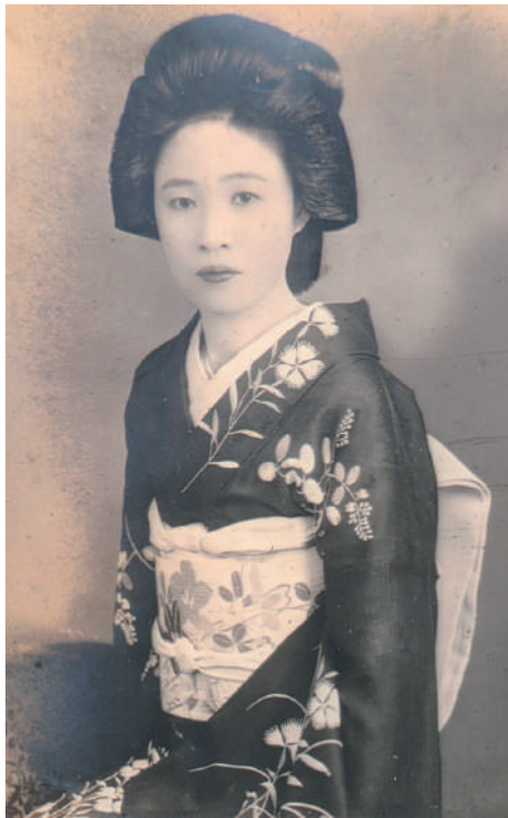
町一番の売れっ子“かの子” 姐さん

昼近くになると、店にはお客以外のいろいろな人達がやって來る。先ずはめでたい“獅子舞”の社中がやって來る。東京の社中連が町々へ散り“ピーヒャラ スケテンテン”というテンポの速い江戸囃子と共に「お