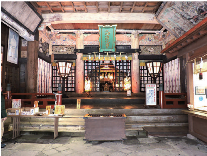
大神山神社奥宮の拝殿の内部