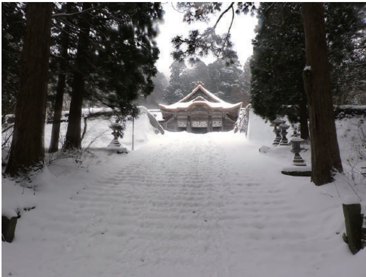
雪の石段を踏みしめて参拝する

大山寺郵便局の先の道を右折して夏山登山口に向かうと、「蓮淨院跡」がある。かつて大山寺には多くの宿坊があり、蓮淨院もその