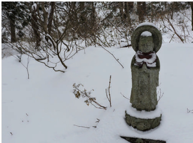
奥宮の参道脇にある石地蔵

神前で柏手を打って叩頭したが、祈願することが出てこない。平穩を望むことが欲張りな世の中になってしまった。大山寺の石段で見た異邦のカップルの姿を思い浮かべ、日本で楽しい時間を過ごしてもらえぬことを祈った。