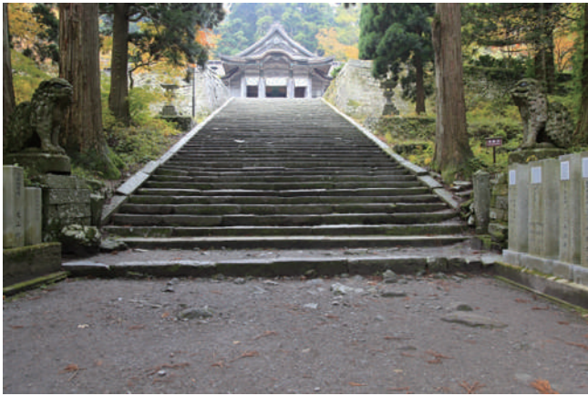
秋の奥宮の石段（フリーサイトの写真を転載）