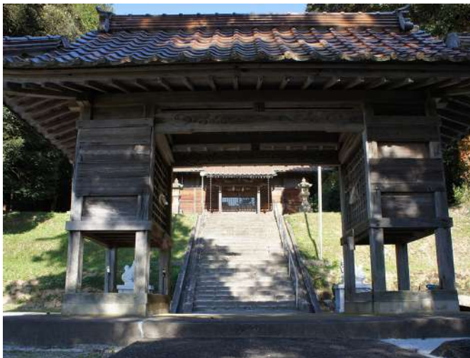
雲南市大東町仁和寺にある諏訪神社(楼門前で撮影)

えている。田んぼのさらに向こうに赤川がある。駅前の道を線路沿いに歩いて県道25号線(玉湯吾妻山線)に出て、川の堤防を下って川原に降りた。下流で堰が上がっているのだから、水の流れが止まっている。水量が多い場所で、カモや白鳥の群れが悠然と泳いでいる。「あつたー」