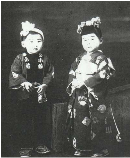
写真館のスタジオで弟と私 （おじさんが亡くなる直前撮影）

があり、兵達は入れない。街のビアホールはクリスマスには盛大なパーティが開かれ、一晩中大騒ぎしていた。この店のママさんは、ちょっと前まで夫が営む写真館の奥さんだったが、夫の急死から間もなく米兵相手の酒場を始めた。ママに言わせると「清水（きよみず）の舞台から飛んだつもりで始めたの」。何の手に職も無い主婦の一大決心だった。数人の若い女性を雇い、昼は英語のできる人から簡単な会話を習い、若い息