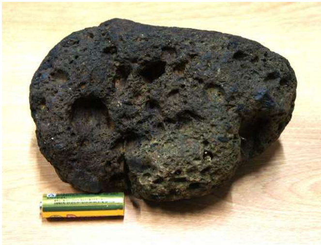
赤川の川原で採取した金屎(鉄滓)