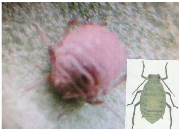
ダイコンアブラムシ (右) とゾンビ化したマミーの姿

無農薬に挑戦しました。しかし写真のように冬のハウスの中とはいえ何処から来たのかアブラムシが葉っぱの裏にいっぱい付いているのです。やむなく粘着テープに着けて取り始めたのですが、中に少し赤みがあった妙な虫が混じっていたのです。早速昆虫に詳しいYさんに見てもらおう。