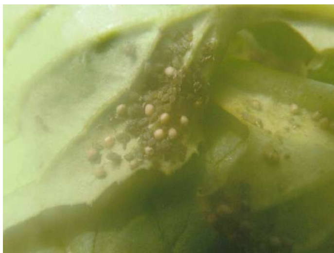
ダイコン葉裏のアブラムシとマミー (ミイラ)