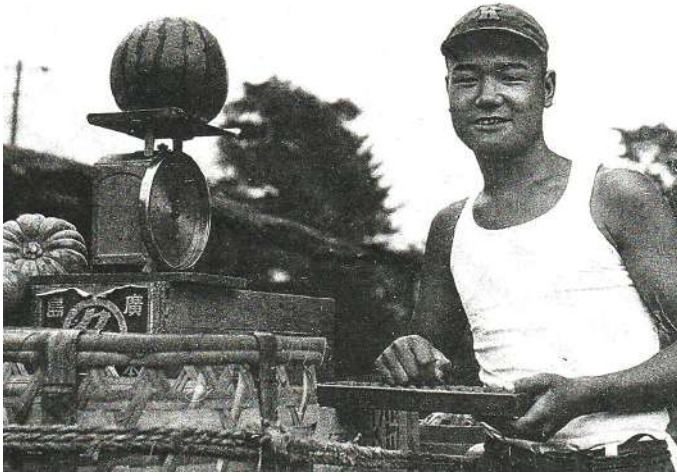
八百屋のおにいさんの引き売り姿

お向かいの畳屋は十一月頃から畳の表換えの注文が増えるので、注文主の家へ出張する人と店で仕上げる