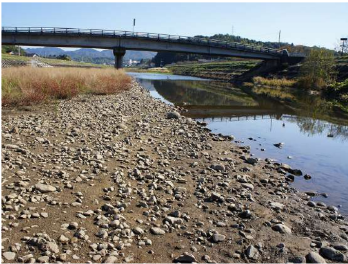
赤川の下流域なので川原には丸い石が多い