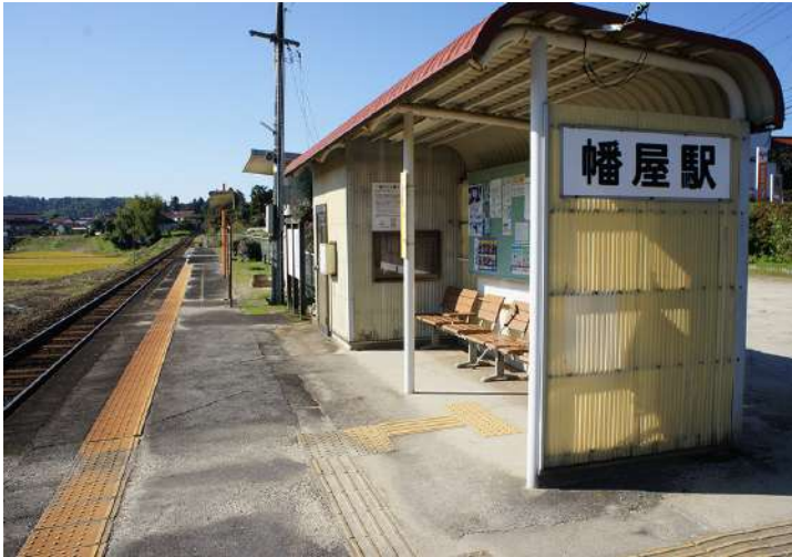
前方が開けた田園でのんびり寛げる