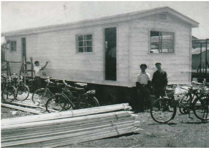
「ジョンソン空軍基地」に接する広い場所に 将校ハウスが次々と建てられた。

地に接する広い場所に「ハイドパーク」と名づけられた将校ハウスが建つ住宅地が出現した。真白いハウスが緑の芝生に点在する様は、まるでアメリカ映画の世界さながらで、有刺鉄線で囲われたハイドパークのゲートには「立入禁止」と書かれた大看板が立ち、中は米国、外は日本、子供の目から見てもその差は歴然としていた。中で生活するアメリカ人家族の母親や子供達の小さっぱりした服、外の子供達はランニングシャ