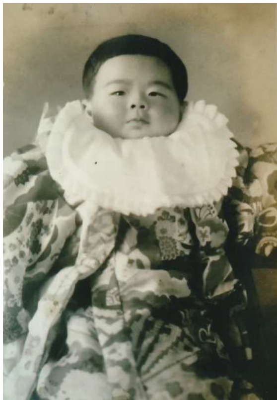
昭和23年、戦後ベビーブームの中で作者は誕生した。

争直後の様子を知る人から見ると「まあ、ちよつと昔のはなしを聞いて」と言いたくなる。そう、戦後間もないこの町は、今では想像もできない程の様々な出来事があり、そんな時代に育った私の子供の頃に見聞きしたはなしを試してみたい。